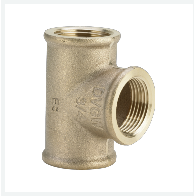
T-stykke model 3130 art.nr. 264 420