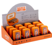
1/4" bitsæt til likekærv/Phillips/Pozidriv/TORX®/sekskantskrue – 12 dele/diskdisplay 59/S31B-IP