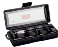
1/4" slagskruetrækkerbitsæt til ligekærv/Phillips/sekskantskruer 55 mm x 90 mm x 220 mm – 15 dele 7865