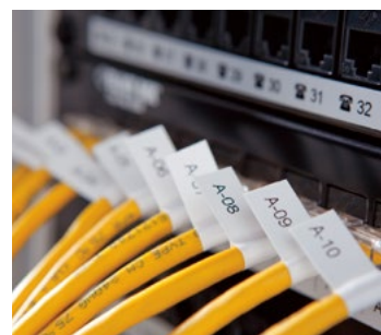
Kabel og klips