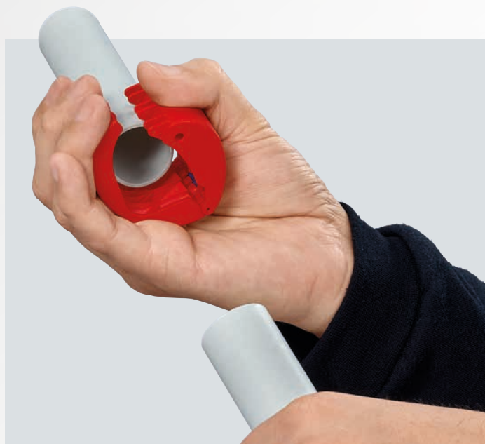
Praktisk, hurtig, færdigt arbejde: Kunststofrør skæres i en håndvending, og alle spåner og skærestreger bliver i værktøjet.