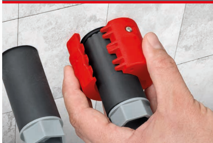
Værktøjets unikke konstruktion med en drejelig knivblok gør det muligt at afkorte tætnings- og samlemuffer helt sikkert med kun 2 til 3 mm vægafstand, så fugten kan ledes sikkert væk.

Tætnings- og samlemuffer beskytter væggen mod varige skader som følge af utætheder.