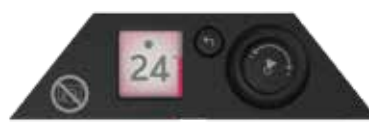
Kontrolenheder til varmepanel