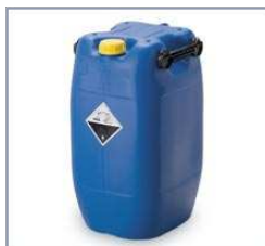
60 ltr. dunke 3-greb

Denne tappehaner passer bla. til følgende emballagetyper: